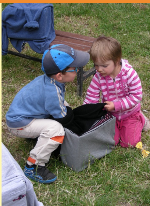
Copak je to tam uvnitř za ptáka?